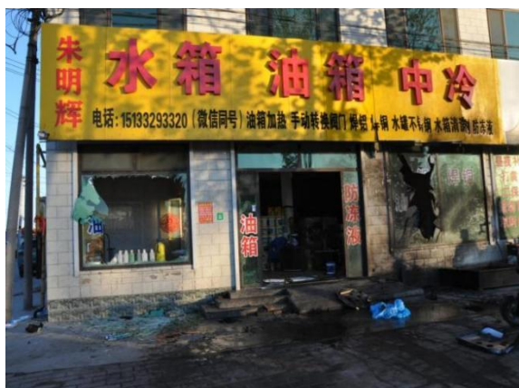
图 3 老朱机动车维修服务部

事故发生地位于老朱机动车维修服务部门前，徐水区路轮通轮胎经营部及老朱机动车维修服务部门窗、玻璃部分破碎，现场无目击证人，根据监控设备资料显示，死者朱明慧平躺于门前空地，爆炸后油箱位于维修作业点西侧 107 国道约 8 米处。（爆炸后位置情况如图 2，爆炸后现场照片如图 3、图 4）