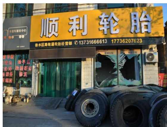
图 4 路轮通轮胎经营部